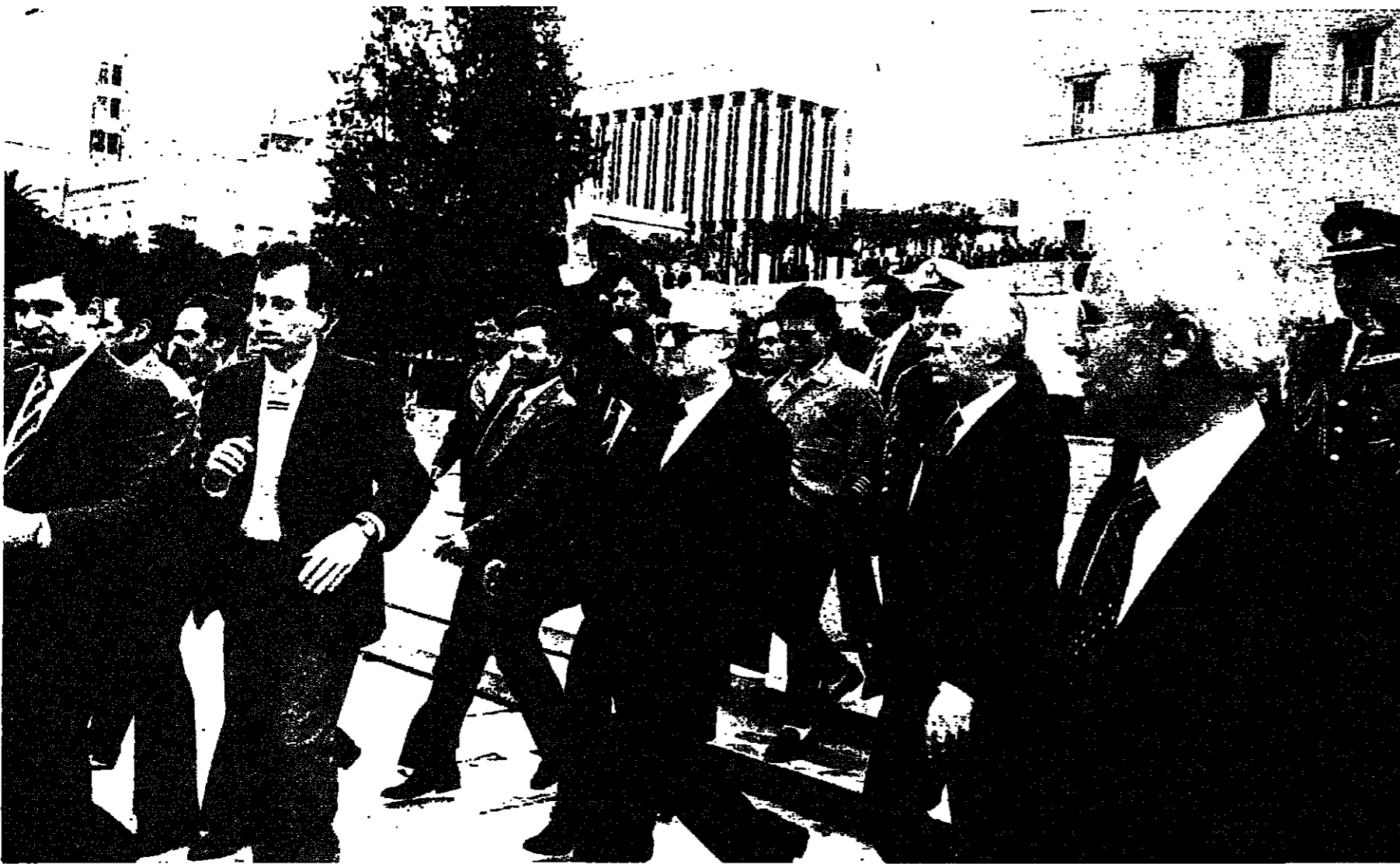
الرئيس اليوناني الجديد خارجا من البرلمان تحية للاختراكيين